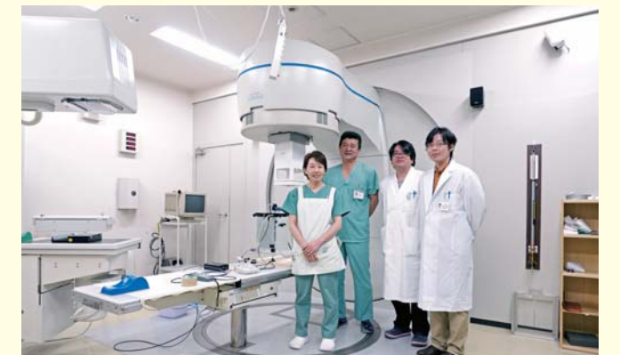
□ 放射線治療装置(リニアック)

放射線治療とは、手術による外科療法、抗がん剤による化学療法と並ぶ3大治療法の一つで、放射線の細胞分裂を止める作用により腫瘍を縮小させる効果を利用しています。放射線治療は通院でも行うことができ、適応疾患によっては切らずに治すことが可能です。