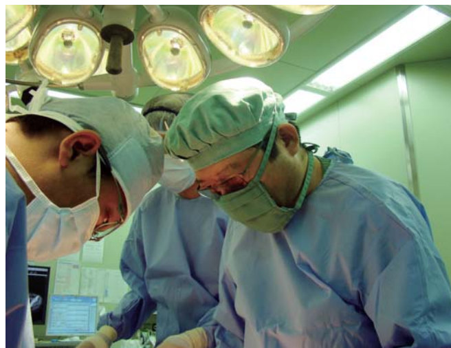
□ 術中写真(右 院長)

緩和ケアチームの発足、病理組織検討会の開催等が不可欠でありその整備を行いました。今後も住民の皆様に対し、よりよい医療を提供していきたいと考えております。