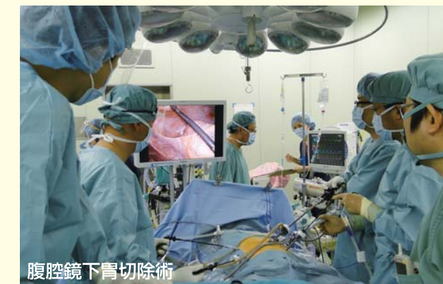
腹腔鏡下胃切除術

の手術症例があり、そのうち101例(34.9%)に腹腔鏡下手術を施行しております。最近では鼠径ヘルニアにも腹腔鏡下手術を導入し、胆石症に対しては単孔式手術(お臍の部分に約2.5cm切ってその孔だけで行う腹腔鏡手術)も行っています。今後も地域の皆様方に質の高い最新の治療を提供できるよう日々努力して行きたいと考えております。