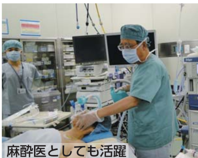
麻酔医としても活躍

2011年12月に呼吸器外科が開設され、1年半になります。医師1名での赴任ですので、制限された診療しかできませんが、それでも外科スタッフの協力を得て肺癌7件、転移性肺腫瘍2件、気胸2件の合計11件の呼吸器外科手術を行いました。肺癌については、当院に呼吸器内科が無いので診断や抗癌剤治療も手