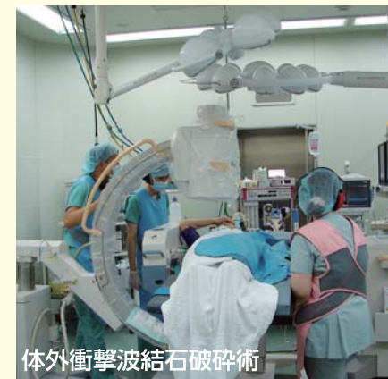
体外衝撃波結石破砕術

では前立腺がんについて2番目に多い悪性腫瘍です。膀胱がんも進行すれば致命的な疾患ですが、約70%は表在性膀胱がん(膀胱壁の粘膜、粘膜下層までの深さで