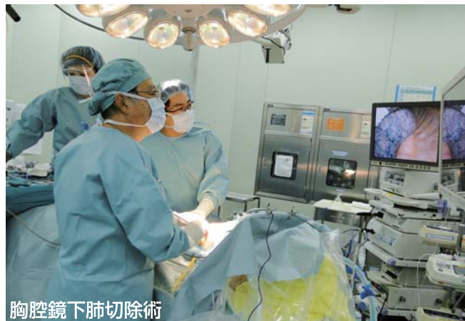
胸腔鏡下肺切除術

掛けていますが、進行した状態で見つかる人も少なく無く、早期発見が切望されます。当院ではCT検診も受けていただくことができますし、外来の看護師さん達も親切ですので、「肺が...?」と思ったら、お気軽にご相談ください。