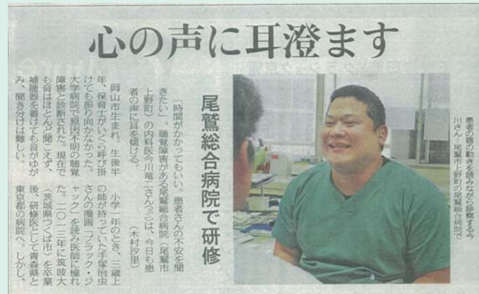
2018.9.8 中日新聞《くろしお版掲載》