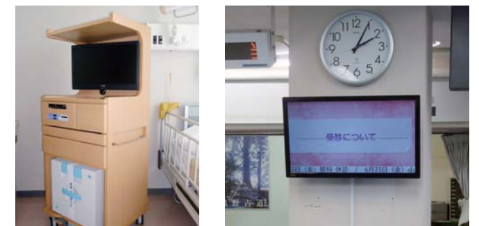
床頭台(入院病棟全部屋) 案内モニター(外来棟2F総合受付)

これまで、休診案内などの情報提供について、情報が少ないとお声を頂いておりましたが、この案内モニターの運用で患者さんに分かりやすい情報を提供できるように、情報提供の充実を図っていきたく思います。