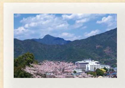
今回お話を伺ったのは

個人的な話で恐縮ですが、私が生まれ育った南勢町(現、南伊勢町)と熊野灘の黒潮でつながっている尾鷲には格別の親しみを覚えます。市民の皆様が安心して生活できる医療体制の整備のために一層努めたいと思いますので、よろしくお願ひします。