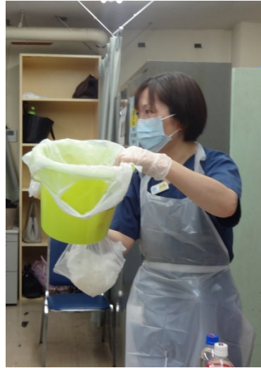
医療安全管理室専任 (→)