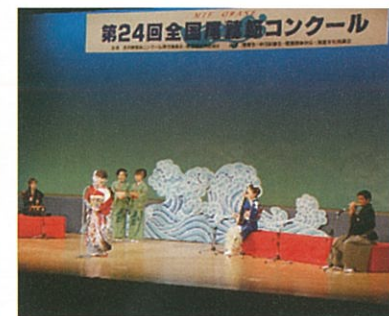
尾鷲節コンクール